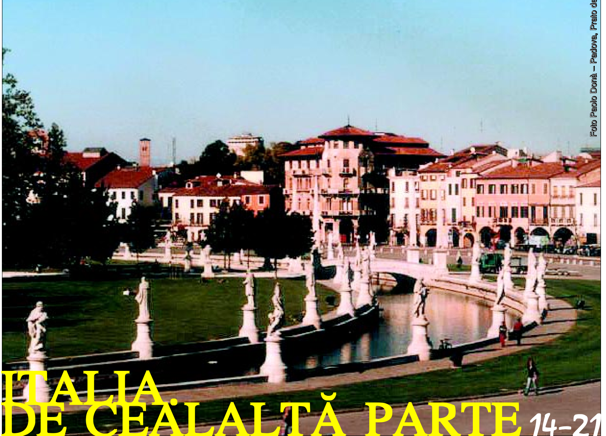
Padova, Prato della Valle